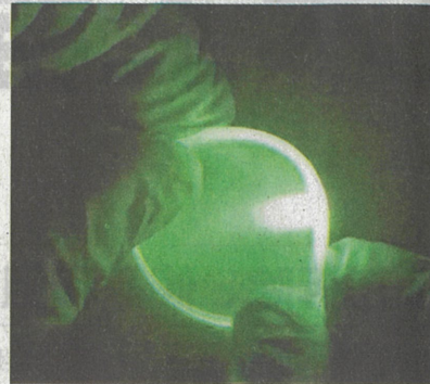
▲新型薄膜的好处是把可以穿透身体组织的不可见光，转化成具消灭癌细胞能力的可见光。